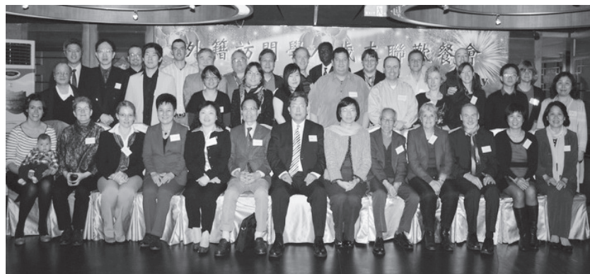
與會外籍學人和參與之來賓合影。