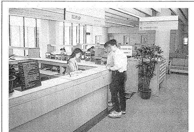
漢學研究資料閱覽室

77年5月間，中心已研擬調整中心組織編制方案，修訂「籌設漢學研究資料與服務中心計畫」，本案於77年1月間已奉核定，調整增加中心工作要項包括：(1)調查蒐集